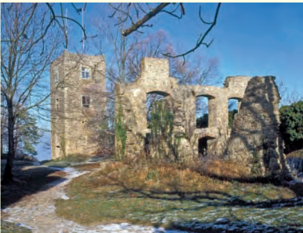
Die Kirchenruine von Süden

Im Jahr 914 wurde mit dem Bau des Verteidigungswerkes begonnen, das sich schon ein Jahr später bei der Belagerung durch König Konrad I. bewährte. Unter Herzog Burkhard III. wurde der Hohentwiel in der Mitte des 10. Jahrhunderts zur schwäbischen Herzogsresidenz mit Kloster. Erst nach 1122 geriet die Festung an die Herren von Singen, die sich nun „von Twiel“ nannten. 1300 erwarben die Herren von Klingenberg die Burg. 1519 suchte Herzog Ulrich von Württemberg auf dem Hohentwiel Zuflucht, beanspruchte ihn schließlich für sich und baute ihn zur Landesfestung aus. Nach zwei weiteren Ausbauten 1660 bzw. 1735 galt diese als uneinnehmbar. 300 Bewohner lebten in der Garnison, die auch als Staatsgefängnis diente.