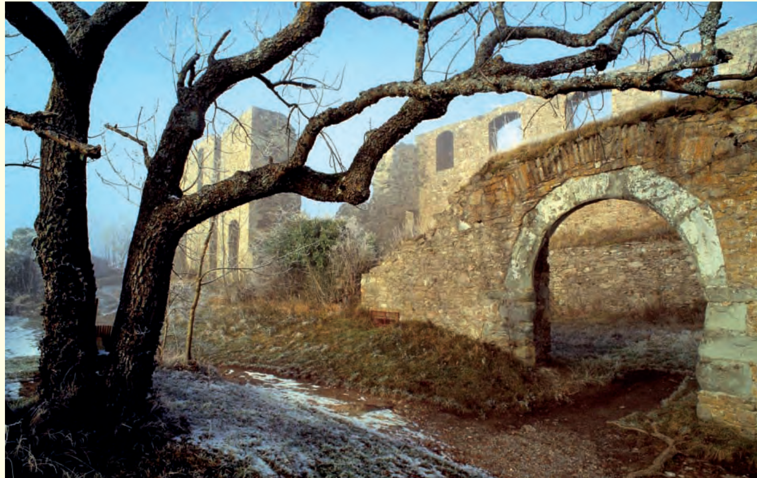
Tor zum Bandhaus in der Oberen Festung

1801, nach der überraschenden Übernahme der Festung, ordnete Napoleon persönlich an, die Anlage zu schleifen. Heute steht die Festungsruine nicht nur für Touristen und Historiker im Blickpunkt. So bildet sie jeden Sommer den stimmungsvollen Rahmen für das Hohentwiel-Musikfestival.